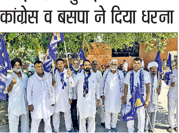
सिरसा। लघुसचिवालय में धरना देते कांग्रेस व रोष जताते बसपा कार्यकर्ता।