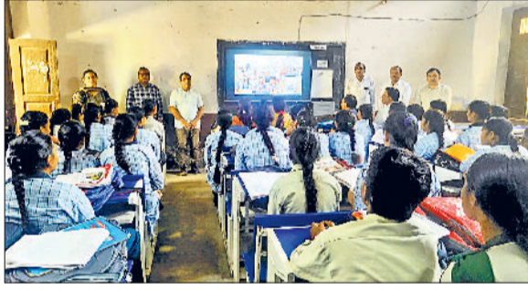
फतेहाबाद। विकसित भारत बिल्डथॉन का लाइव सेशन देखते विद्यार्थी।