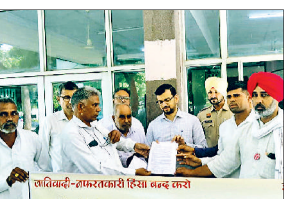
लघु सचिवालय पर किया प्रदर्शन