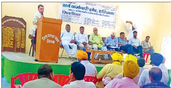
सिरसा। एसकेएस के कार्यक्रम में उपस्थित उपस्थित सदस्य।