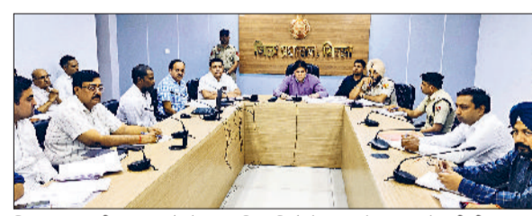
सिरसा। पराली प्रबंधन को लेकर अधिकारियों के साथ बैठक करते एडीसी।

अधिकारी फील्ड में उतरकर अपने क्षेत्र में रखे निगरानी, पराली प्रबंधन के लिए किसानों को करें और जागरूक