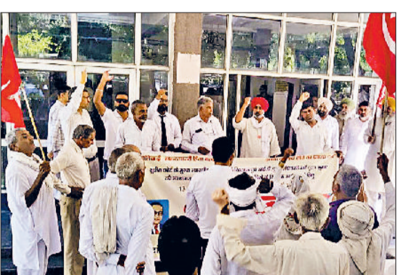
फतेहाबाद। डीसी कार्यालय पर प्रदर्शन करते विभिन्न जनसंगठनों के कार्यकर्ता व प्रदर्शन के बाद अधिकारी को ज्ञापन सौंपते जनसंगठनों के कार्यकर्ता।