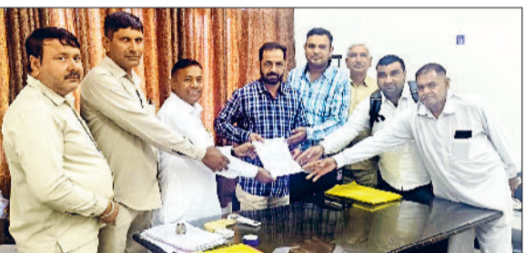
फतेहाबाद। एओ को ज्ञापन सौंपते रोडवेज यूनियन के पदाधिकारी।

एक तरफ प्रदेश सरकार के पास दिन-रात मेहनत करने वाले रोडवेज कर्मचारियों को लाभ देने के लिए बजट नहीं है वहीं दूसरी ओर सरकार को कोरोना काल में खड़ी रही ठेके की किलोमीटर स्कीम की बसों की 40 से 50 करोड़ की पेमेंट देकर सौगात दे रही है। रोडवेज कर्मचारी यूनियन एटक सरकार के एक फैसले का पुर्जोर विरोध करती है। यूनियन ने प्रदेश के परिवहन मंत्री को पत्र लिखकर इस मामले की जांच