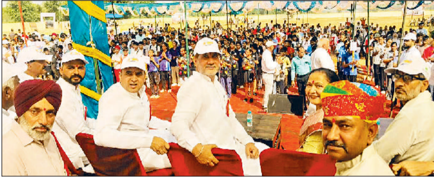
सिरसा। सांसद खेल महोत्सव कार्यक्रम में मौजूद राज्यसभा सांसद सुभाष बराला व अन्य।

राज्यसभा सांसद सुभाष बराला ने कहा कि खेल एक ऐसा क्षेत्र है, जहां पर व्यक्ति विशेषकर युवाओं को जीवन में आगे बढ़ने की सही दिशा मिलती है। खेल व्यक्ति को न केवल शारीरिक और मानसिक तौर पर मजबूत बनाता है, बल्कि सामाजिक समरसता को भी बढ़ावा देता है। देश के युवा व सामाजिक समरसता को सुदृढ़ बनाने के उद्देश्य से सांसद खेल महोत्सव की शुरुआत की गई है। सांसद बराला सोमवार को सिरसा जिले के गांव रामपुरा बिश्नोइयां व खुड़ियां मलकाना में सांसद खेल महोत्सव के शुभारंभ पर उपस्थित लोगों को संबोधित कर रहे थे। उन्होंने खेल व्यवस्थाओं के लिए रामपुरा बिश्नोइयां में 10 लाख रुपये तथा खुड़ियां मलकाना में 5 लाख रुपये देने की घोषणा की। इसी के साथ गांव खुड़ियां मलकाना में गांव से स्टेडियम तक सड़क बनाने की भी घोषणा की।